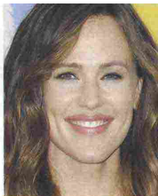
Jennifer Garner, 45 anni