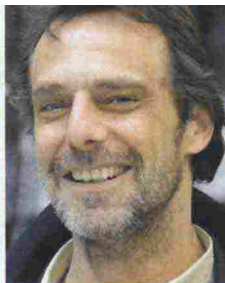
Alessandro Preziosi, 44 anni